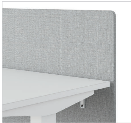
Optionaler an der Tischplatte montierter Beisichtschutz