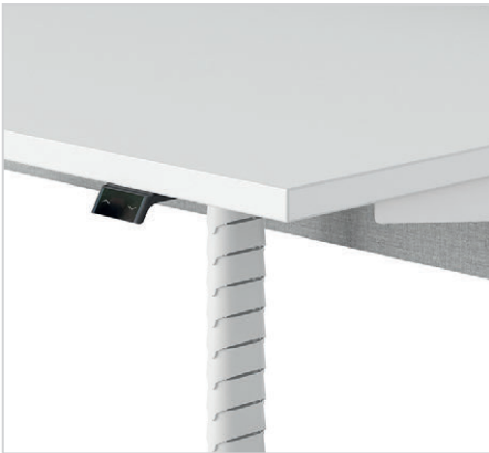
Standard- oder textile Kabelführung

Umfassende Informationen über Merkmale und Optionen der höhenverstellbaren Nevi Schreibtische finden Sie unter hermanmiller.com