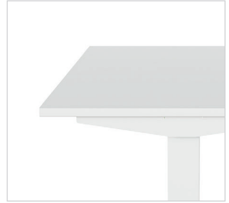
Melamin-Arbeitsplatte mit eckiger Kante