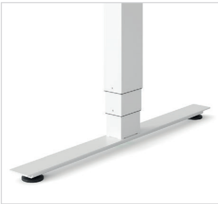
Höhenverstellbares Gestell mit T-Fuß